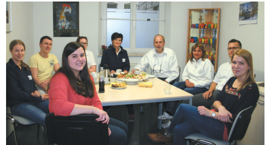
Freude über die bestandene Gesellenprüfung.

Im Januar 2017 fand für unsere Auszubildenden im 4. Lehrjahr die Abschlussprüfung im Zahntechniker-Handwerk statt. Wir gratulieren allen unseren Auszubildenden zur bestandenen Prüfung. Mit guten und sehr guten Noten konnten sie ihre Gesellenbriefe in Empfang nehmen. Drei Jungtechniker haben sich für eine Weiterbeschäftigung im Betrieb entschieden und werden in Zukunft unser Team unterstützen. Die guten Abschluss-ergebnisse unterstreichen einmal mehr die hohe Ausbildungsqualität im Zahntechnik Zentrum Eisenach.