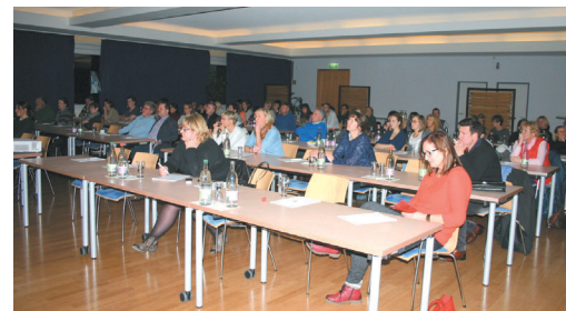
Wir durften wieder zahlreiche interessierte Zahnärztinnen und Zahnärzte beim Seminar begrüßen.