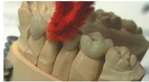
Jochen Peters zeigte wesentliche Erfolgsfaktoren für perfekt sitzenden und funktionellen Zahnersatz auf und erläuterte rationelle Arbeitsschritte für die Zusammenarbeit zwischen Praxis und Labor.

Es ist schon eine gute Tradition geworden, dass wir Ihnen einmal im Jahr einen individuell gestalteten Jahreskalender für Ihre Praxisräume zur Verfügung stellen. Im letzten Jahr war das Thema „Thüringens Gärten“. Für den Kalender 2018 dachten wir, Sie haben vielleicht Lust, den Kalender gemeinsam mit uns zu gestalten. Schicken Sie uns einfach schöne Fotos als Bilddatei und wir wählen die besten Schnappschüsse oder auch professionell fotografierte Motive aus, um den Kalender zu gestalten. Das Ergebnis wird eine Überraschung werden. Wir würden uns freuen, wenn Sie diesen kleinen Spaß mitmachen.