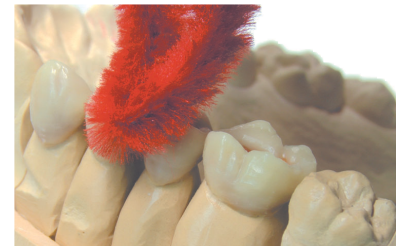
Herr Peters zeigt Erfolgsfaktoren für perfekt sitzenden, funktionellen Zahnersatz auf und erläutert rationelle Arbeitsschritte für die Zusammenarbeit zwischen Praxis und Labor.

Sichern Sie sich frühzeitig Ihre Teilnahmeplätze an unseren Fortbildungsveranstaltungen.